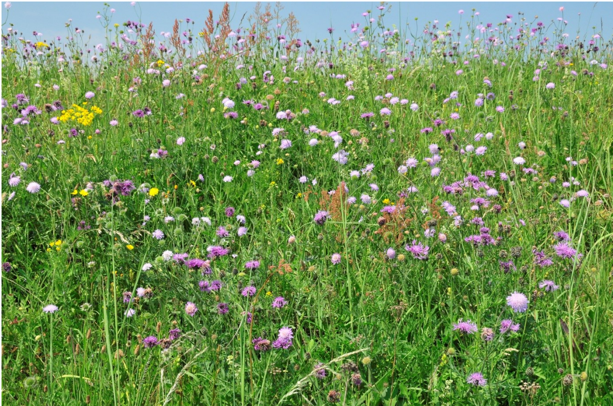
Een soortenrijk glanshaverhooiland (H3 in VTV2006) met onder meer Glanshaver, Grote centaurie, Beemdkroon, Groot streepzaad, Rolklaver, Geoorde zuring, Glad walstro, Smalle weegbree, Veldlathyrus, Gestreepte witbol en Jacobskruiskruid.

Een beeld zegt meer dan 100 woorden. Onderstaande foto geeft goed weer wat bedoeld wordt met een bloemrijke dijk. Naast verschillende soorten grassen zijn ook verschillende kruiden (met opvallende bloemen) aanwezig op het talud van de dijk.